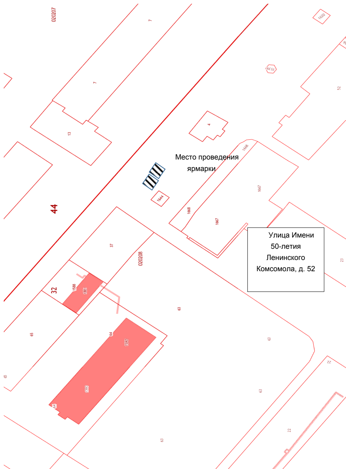
Приложение 2 к постановлению администрации городского округа город Волгореченск Костромской области от 01.03.2021 № 128